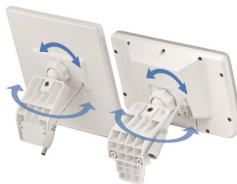
Conexiones mecánicas móviles, cable de 3m