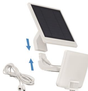
LED proyector con panel solar y PIR sensor