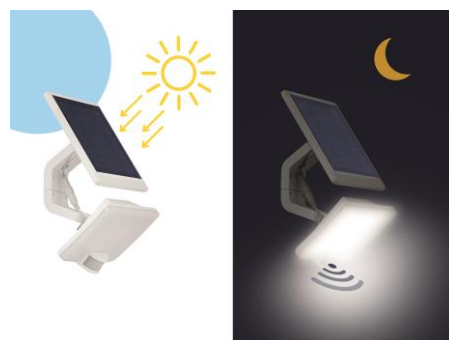
Modos de funcionamiento del proyector